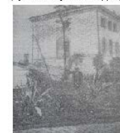
Ботанический сад (во дворе главного корпуса университета)

существования ИНУ открыты 6 клиник при медицинском факультете и Лиманное отделение Терапевтической госпитальной клиники.