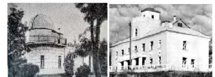
Здание Астрономической обсерватории (архитектор П. В. Йодко)

Расширялась инфраструктура, открывались новые кафедры и научные общества, строились новые корпуса. В этот период были построены: здание Астрономической обсерватории, Приморская биологическая станция, создан Ботанический сад, перестроен и открыт новый корпус по адресу: ул. Преображенская, 24; возведен комплекс корпусов медицинского факультета.