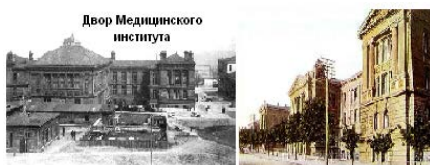
Двор Медицинского института