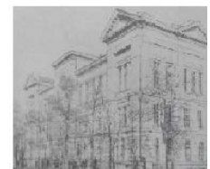
Корпус университета (ул. Преображенская, 24)