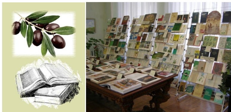
Ил. 7. Эмблема выставки